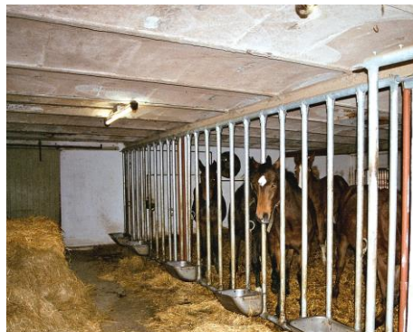
Løsdrift og gruppeopstaldning (se bilag 1).

Ved gruppeopstaldning kan der være et areal omkring foderbordet, hvor der vanskeligt kan holdes tørt, eller hvor der er trafik af heste. Tilsvarende gælder for løsdrift (se bilag 1), hvor det også vil gælde arealet ved ud- og indgange. Dette er baggrunden for, at der er indsat et mindstekrav til størrelsen af et velstrøet og tørt liggeareal.